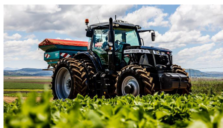
Die sewejarige Carter Braithwaite het die treffende kleur voorgestel en die trekker Black Beast gedoop.

RTK-ontsluiting vir akkuraatheid van 3,2 tot 3,8 cm. Volledige ISOBUS-stuur maak voorsiening vir intuïtiewe seksie- en koersbeheer.