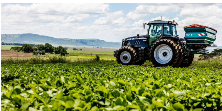
Dieter Schroder het nou die beste trekker vir Noodhulp se nuwe drieton-kunsmisstrooier.

Sven beklemtoon dat die AGCO ASK-stelsel wat gebruik is om die kragtige, hoë-spesifikasie trekker uit die MF 7700 S-reeks saam te stel, 'n handelaar soos DAS in staat stel om ten volle te reageer op spesifieke vereistes van