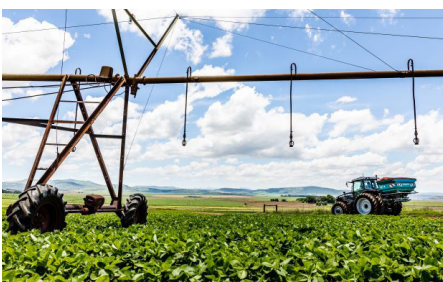
Noodhulp het 1 100 ha per jaar onder besproeiing.

boere, van bandgrootte tot hidrouliese olie-vloei en verskillende stuuropsies vir presisieboerdery.