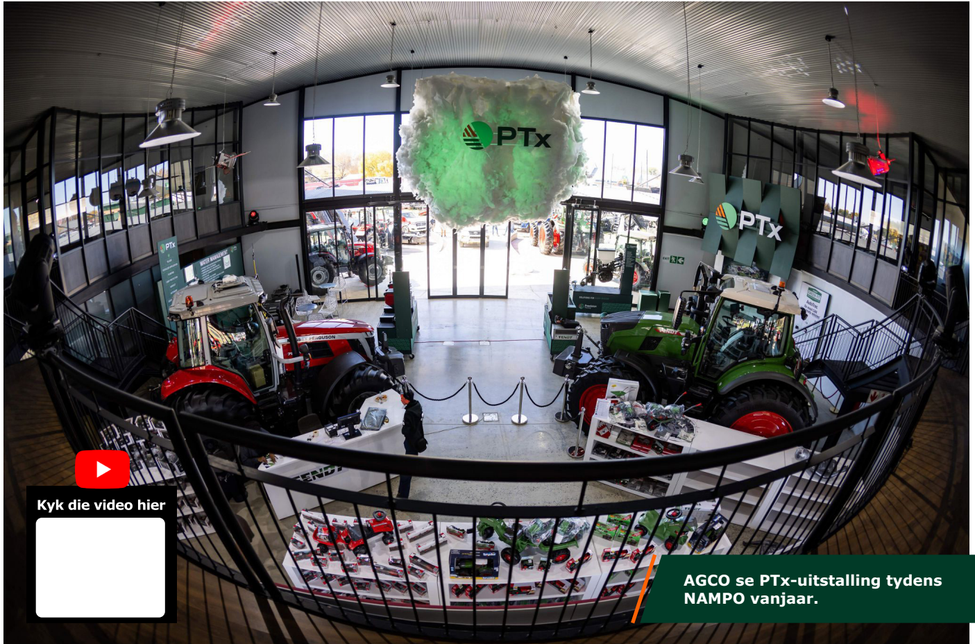
AGCO se PTx-uitstalling tydens NAMPO vanjaar.

D ie wêreld van presisieboerdery ontwikkel vinnig, en AGCO is aan die voerpunt met hulle nuwe tegnologie-aanbieding wat AGCO se presisieboerdery-oplossings onder een dak saambring. Dit sluit onder meer PTx Trimble en PTx Precision Planting in.