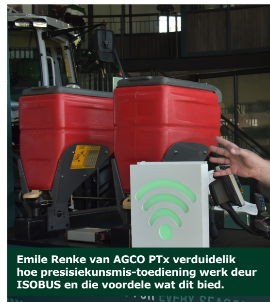
Emile Renke van AGCO PTx verduidelik hoe presiesiekunsmis-toediening werk deur ISOBUS en die voordele wat dit bied.